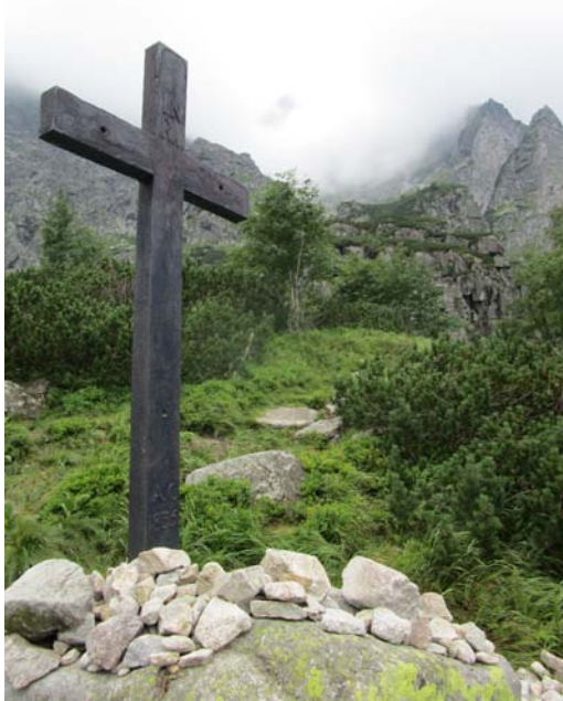
Fig. 6. Cruz de madera en las faldas de los Tatras.