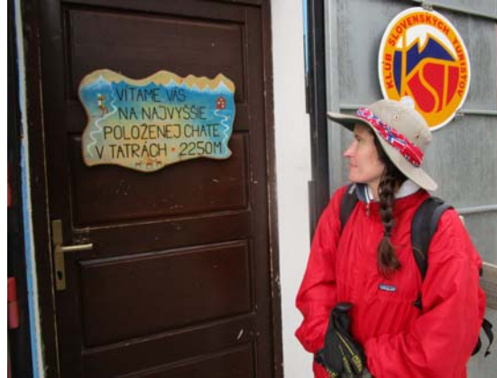
Fig. 10. Refugio de montaña en las alturas de los Tatras