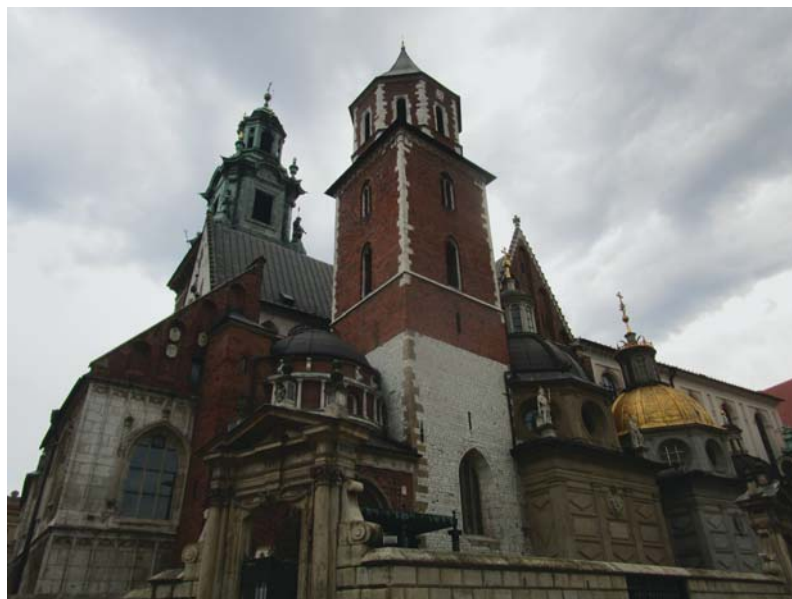
Fig. 1. Colina de Wawel.

Key Words: Tatra mountains - Wawel hill - religious tourism - cultural heritage - Poland