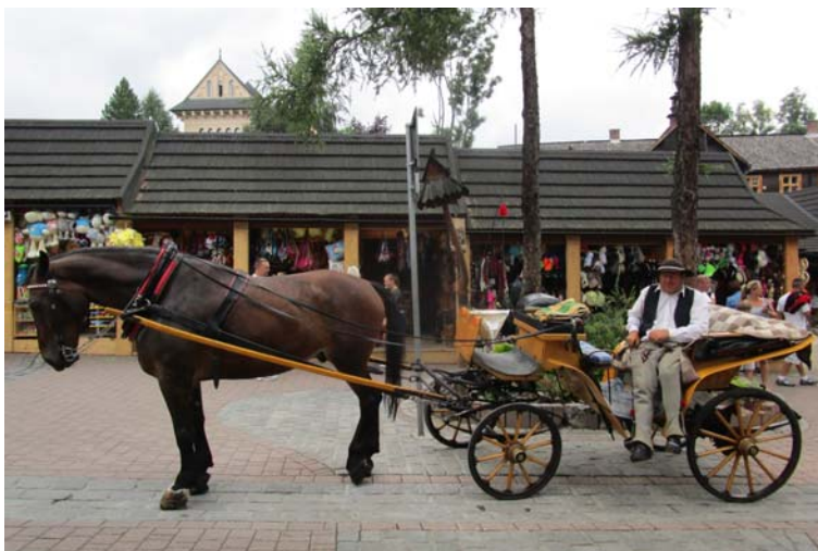
Fig. 11. Turística aldea de montaña de Zakopane (© MCC)

Situada al pie de los montes Tatras, la aldea de Zakopane es la capital de invierno polaca y un rincón sumamente pintoresco de la región de Malopolska, donde el folclore, las tradiciones, los dialectos y los trajes típicos de los montañeses forman parte de la vida cotidiana de sus habitantes. Cientos de visitantes na-