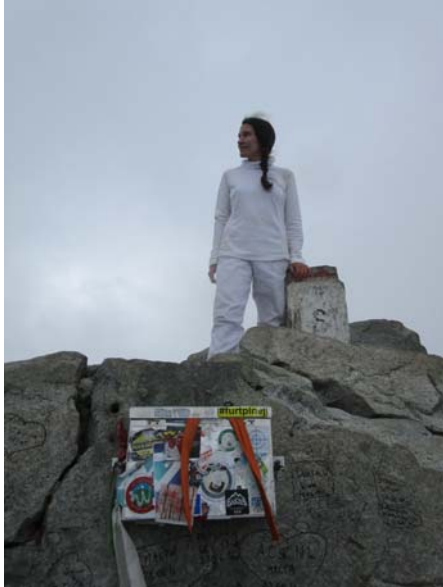
Fig. 8. La autora en la cima más alta de Polonia