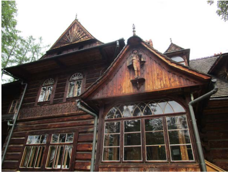
Fig. 13. Arquitectura de madera típica de Zakopane (© MCC)