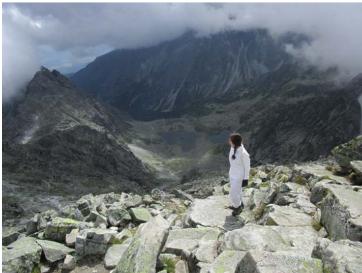
Fig. 9. Descenso por la vertiente eslovaca