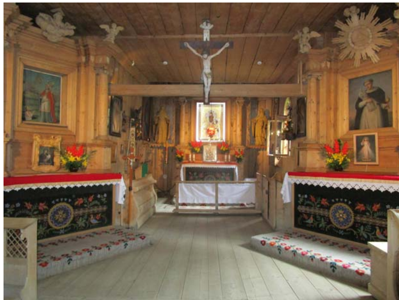
Fig. 14. Interior pintado de una iglesia polaca de madera (© MCC)