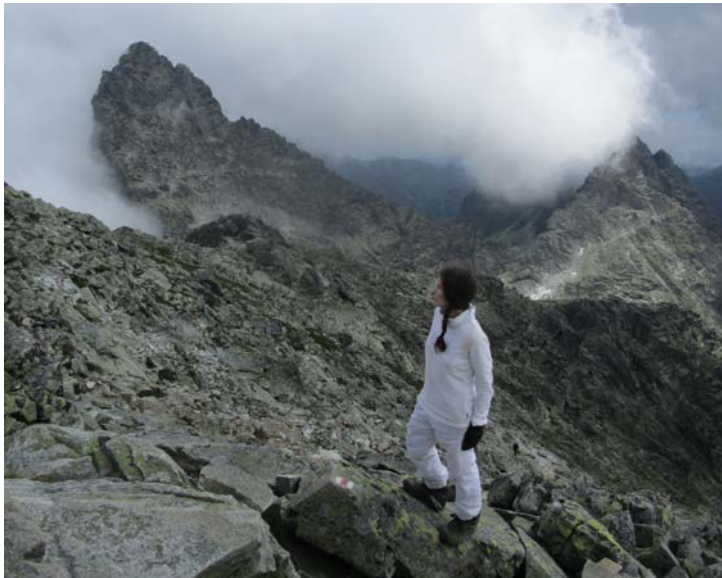
Fig. 7. Ascenso al Pico Rysi.