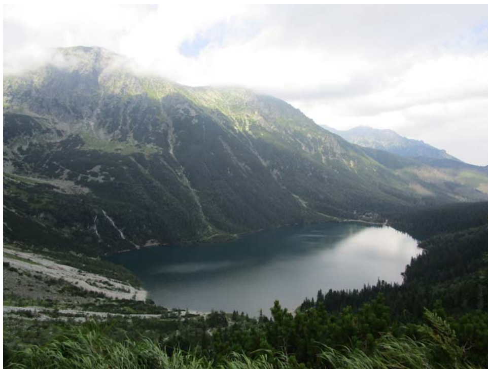
Fig. 4. Lago Morskie Oko al pie de los altos Tatras.

La visita a las orillas del lago Morskie Oko es una actividad turística popular y recreativa, que congrega diariamente, en época estival, a miles de visitantes procedentes de distintas regiones de Polonia. Cientos de excursionistas cubren a pie los diez kilómetros en suave pendiente ascendente que separan el ingreso al parque nacional del refugio de montaña situado al borde del lago. Sin embargo, la tradición invita a utilizar los servicios de pintores-