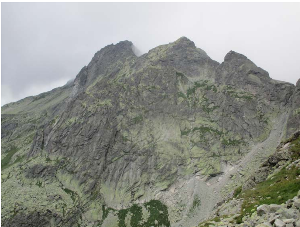
Figura 3 - El pico Rysi en los montes Tatras

Las laderas de los Tatras están tapizadas de bosques de pino negro. La flora de los pastizales de altura incluye especies como la