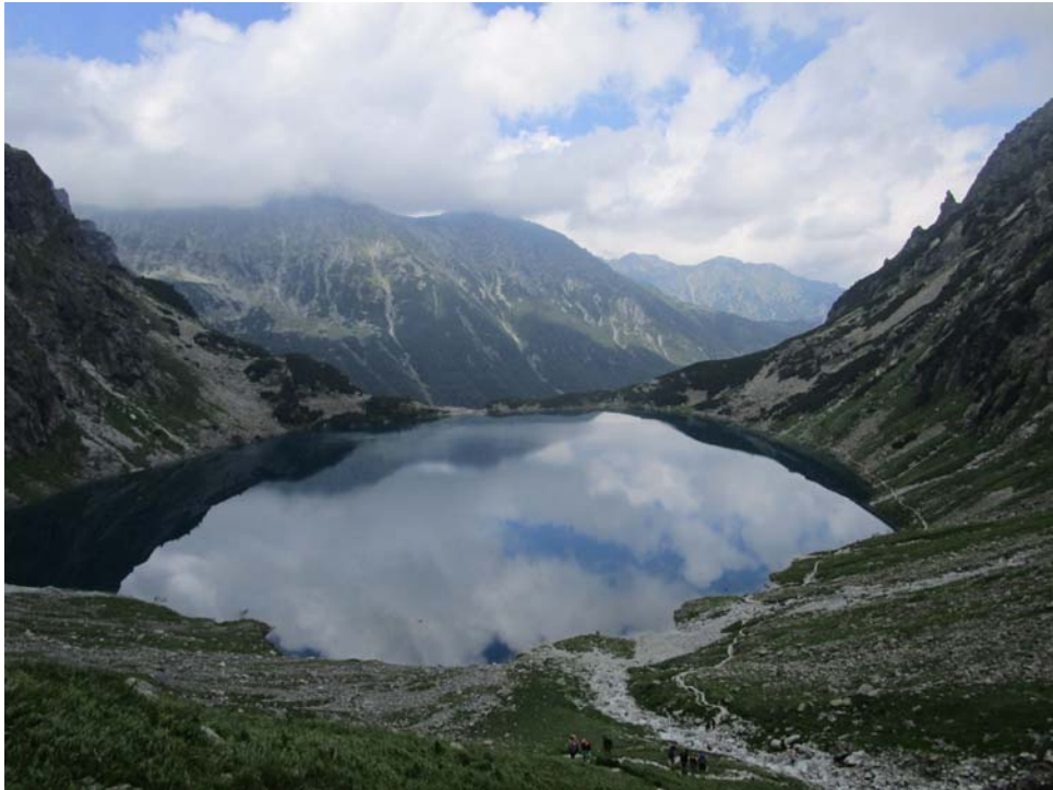
Fig. 5. Sendero de montaña junto al Lago Negro.

Una pequeña cruz se encuentra erigida junto a un apilamiento de piedras (Figura 6) en un punto desde donde se aprecian simultáneamente el vecino lago Negro, las cercanas faldas de los montes Tátras y el vasto panorama sobre el lago Morskie Oko, bastante más abajo. Este lugar suele ser el punto desde el cual los visitantes toman fotografías y selfies .