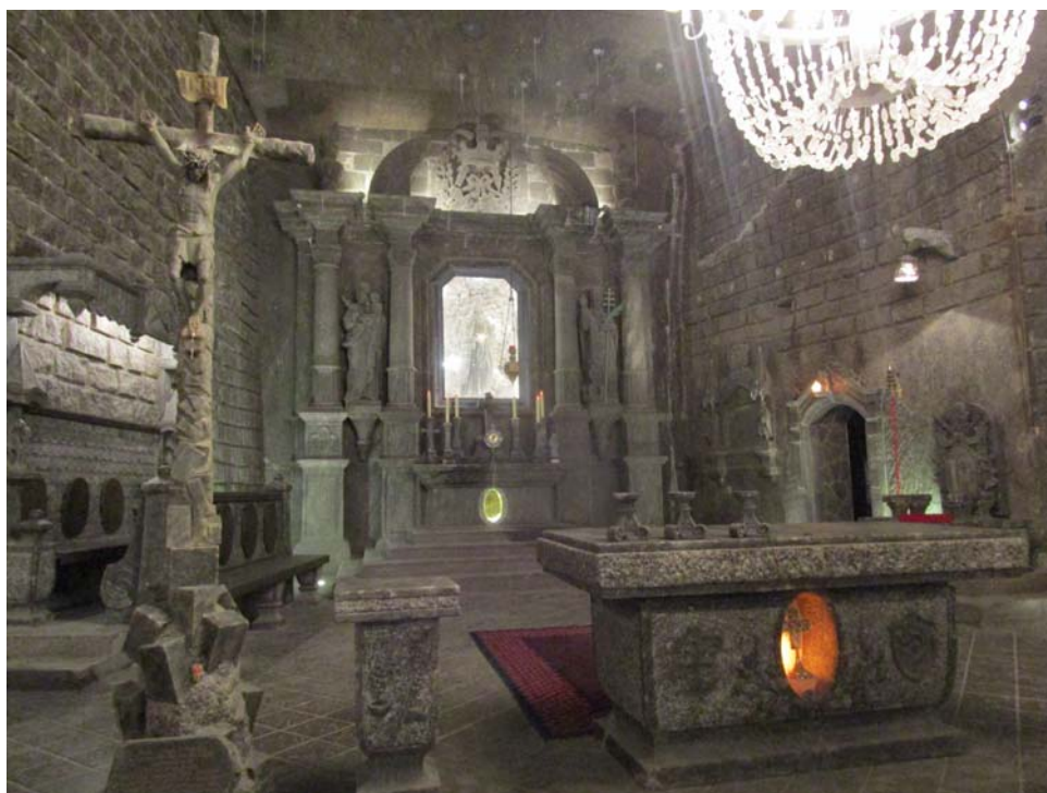
Fig. 2. Iglesia subterránea en bloques de sal en Wieliczka.

El clímax de la experiencia es el ingreso a templos únicos en el mundo, tanto por su situación —a considerable profundidad bajo tierra— como por estar íntegramente labrados en sal (Figura 2). Además de la capilla dedicada a Santa Kinga se recorren otras, como la consagrada a Santa Cunegunda (que se remonta al siglo XVIII) y la capilla barroca de San