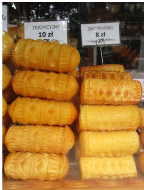
Fig. 12. Queso de oveja ahumado oscypek

Las distintivas construcciones en madera de Zakopane forman parte de una ruta de la arquitectura de madera, jerarquizada por la UNESCO, que incluye también a las iglesias